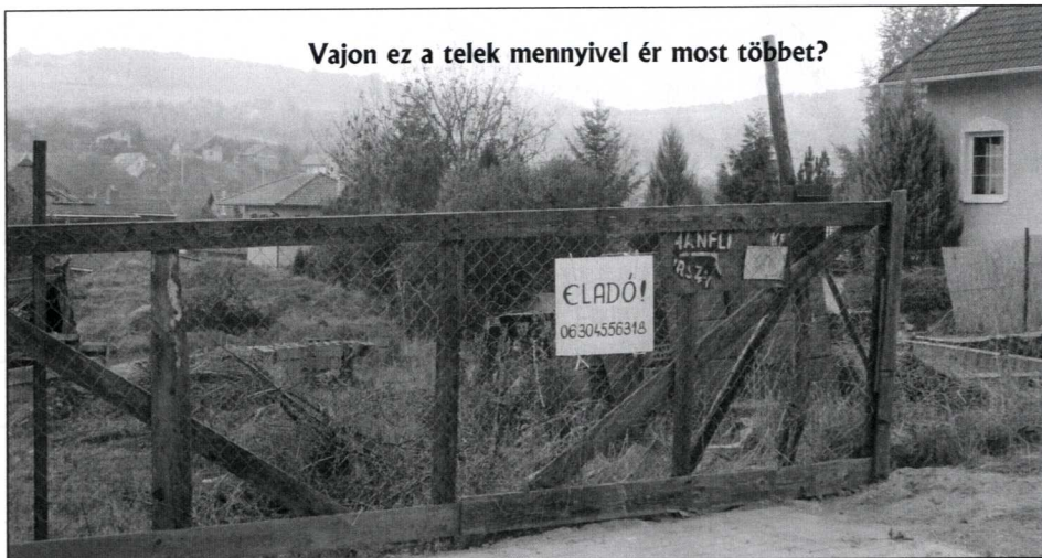
Vajon ez a telek mennyivel ér most többet?